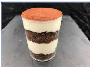
提拉米蘇慕斯杯 20入1200元